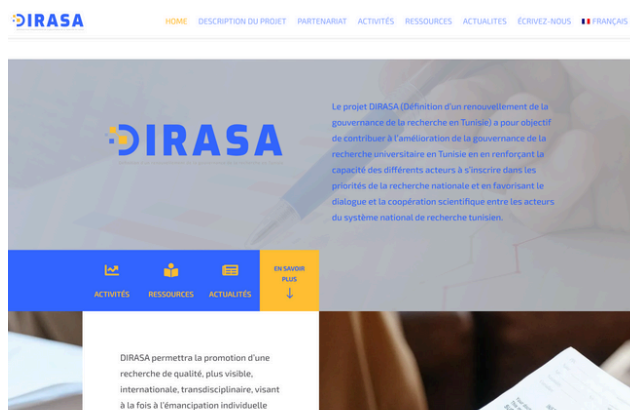
La page d'accueil du site DIRASA, vitrine des activités, événements et résultats du projet.

Il vise à soutenir la gouvernance de la recherche scientifique en Tunisie et à encourager la coopération entre universités, chercheurs et institutions partenaires.